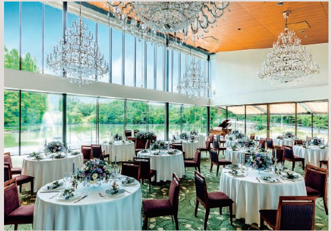
メインダイニング