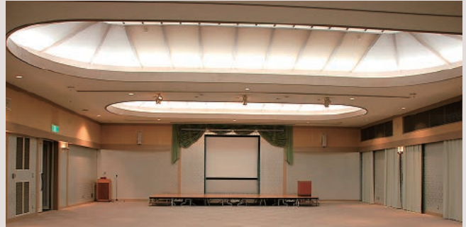
キャッスルホール