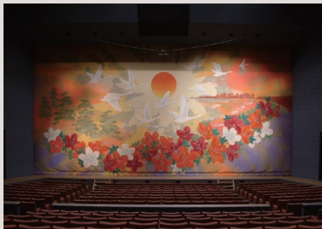
大ホール「ユーフォニーホール」