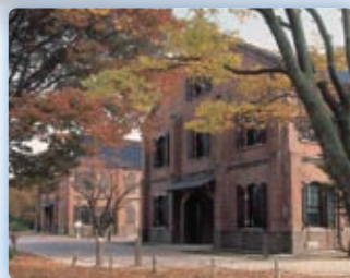
石川県立歴史博物館