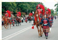
百万石まつり (6月上旬)