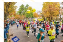
金沢マラソン (10月最終日曜日)