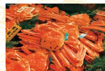
加能がに(解禁 11月上旬)