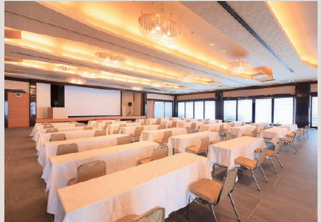
コンベンションホールさくら