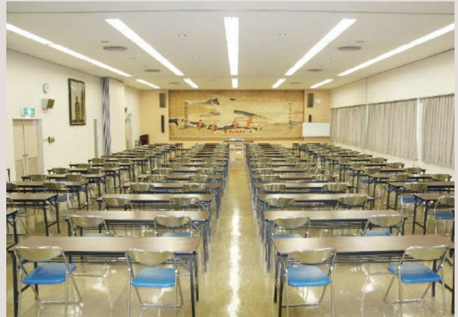
3F ホール (大集会室)