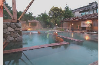
田んぼの湯立ち湯・大の字湯