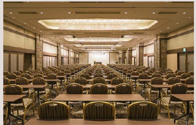
コンベンションホール天祥